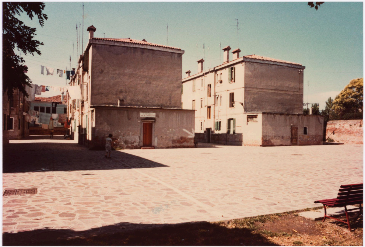
Giudecca: appartementengebouwen bestaande toestand jaren 60 vorige eeuw